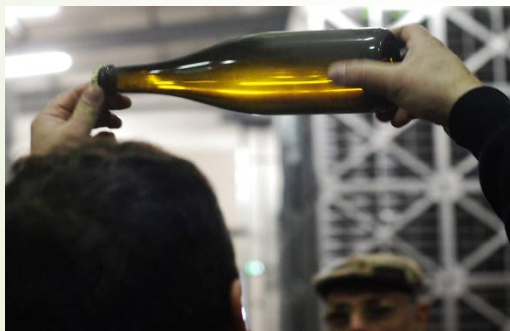
Bouteille prête à être dégorgée

Mr Loisy a détaillé les méthodes de travail pour la montée en pression des vins effervescents et leur dégorgement avant l'embouteillage.