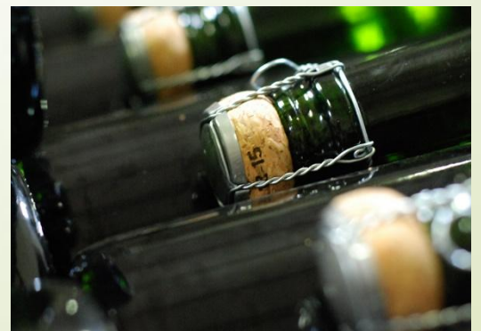
Bouteilles sur le point d'être habillées.