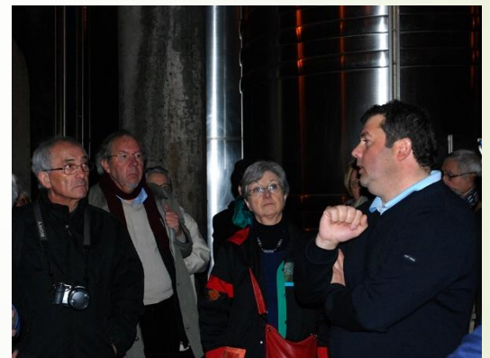
Discours de la méthode et précisions techniques