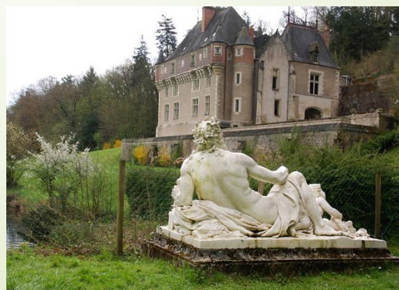
Statue Le Rhône