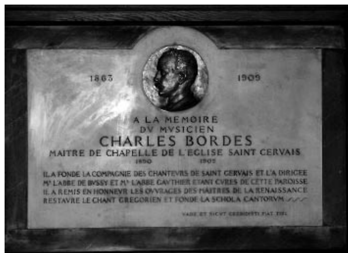
Stèle à Charles Bordes située dans l'église Saint-Gervais.