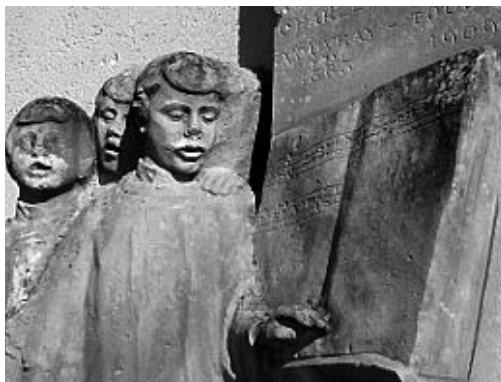
Le monument à Charles Bordes sur l'église de Vouvray.